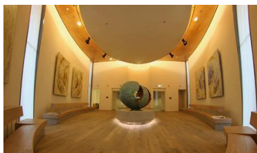
Stille Ruimte OMC kunstwerken van Joseph Cals